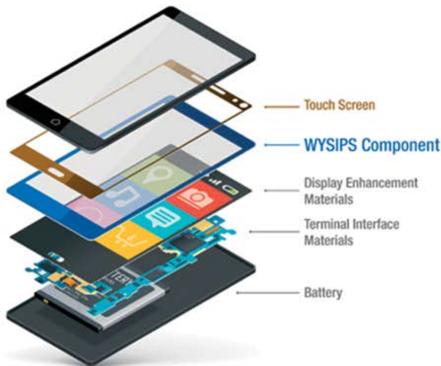
La technologie Wysips intégrée dans les smartphones